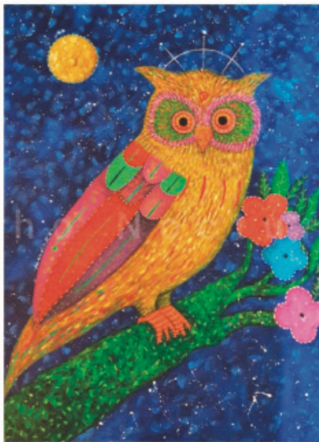
Búho nocturno Acrílico en lienzo 60X80cm