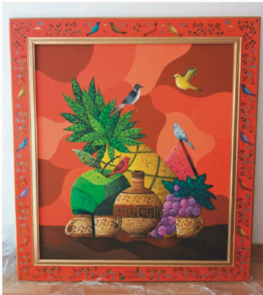
Comida familiar 80X90cm / Acrílico

dado esta amena y muy divertida entrevista. Conocer es conocer tu obra de cerca y realmente expresas en ella tu alma y lo que quieres comunicarnos a través de ella. La naturaleza, la maestría de tu técnica con el dibujo y los colores vibrantes y brillantes, nos hacen imaginarnos un mundo de fantasía muy a la mexicana, transportándonos a mundos distintos, pero muy especiales.